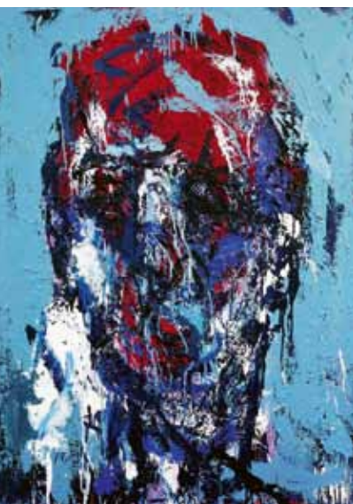
Testa, 2002-2003, Öl auf Leinwand 115 x 95 cm