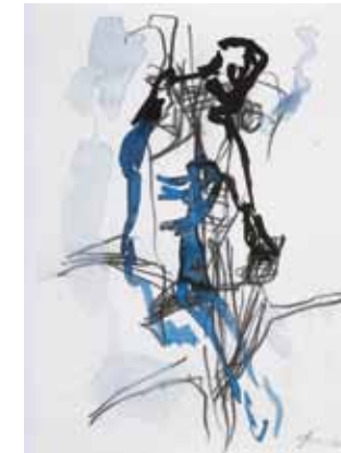
Figura, 2011, Gouache und Bleistift auf Papier 24 x 19 cm