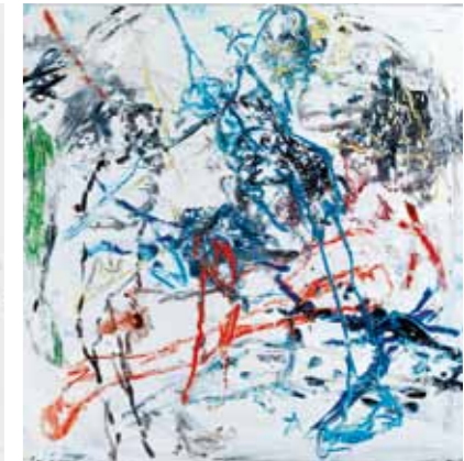
Figura, 2011, Gouache und Bleistift auf Papier 24 x 19 cm Spaziotempo, 2010, Öl auf Leinwand 100 x 100 cm