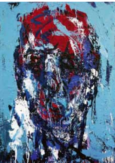
Testa, 2002-2003, Öl auf Leinwand 115 x 95 cm