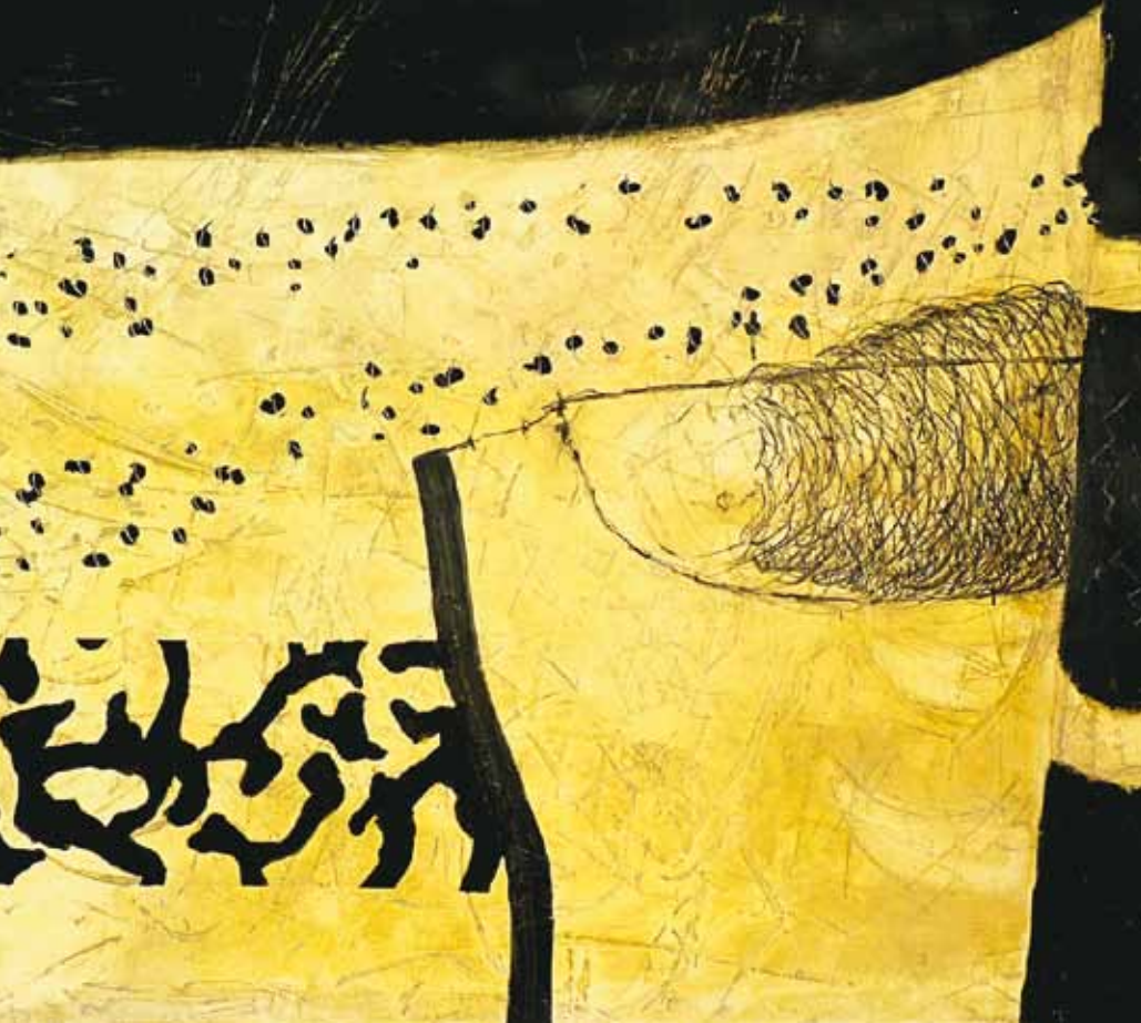
Bootmensch 100 x 120 cm

Ihre Bilder faszinieren die Menschen und laden zum Verweilen ein. Sie zeigen Samen und Früchte, Menschen und Boote, Nester und Kokons in erdigen Farben. Sobald man sich auf die Bilder einlässt, erzählen sie vom ewigen Kreislauf des Lebens, von Leben und Tod, von Werden, Sein und Vergehen. Barbara Seifried ist eine Malerin, deren Bildinhalte sich erst auf den zweiten Blick erschließen. Die leichten und harmonischen Bilder zeigen sich dann tiefgründig, reflektiert und bedeutungsvoll.