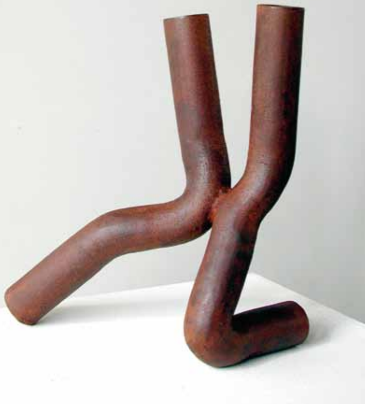
Chromosom 33-L-12, 25,5 x 19 x 15 cm