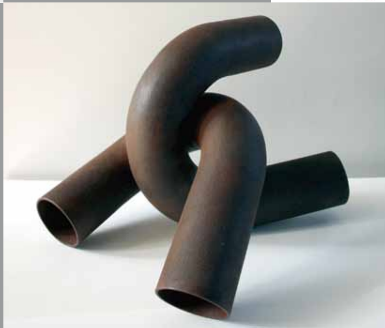
Chromosom 80-L-8, 55 x 31 x 40 cm